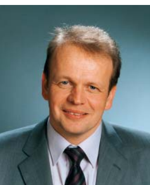
Bjarni Djurholm landsstýrismaður í vinnumálum